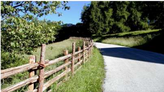
Bild 5: Stangenzaun am Regglberg mit dünnerem und längerem „Zusteck'n“