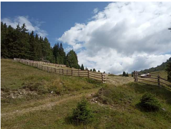
Bild 8: Beispiel eines genagelten Stangenzauns im oberen Pustertal

Die Säulen können bei genügender Stärke gespalten oder mit der Säge geteilt werden. Die Stangen/Latten können ebenfalls bei genügender Stärke halbiert werden. Sie werden entweder übereinander (Bild 9) oder stumpf zueinander (Bild 10) mit Nägeln oder Schrauben an der Säule befestigt.