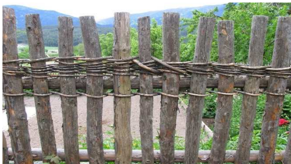
Bild 14: Speltenzaun mit geschnittenen Hölzern und einfacher Flechtung