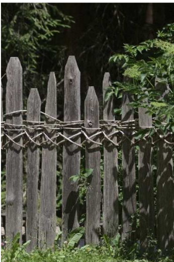
Bild 13: Klassischer Speltenzaun mit gespaltenen Hölzern und Kreuzflechtung